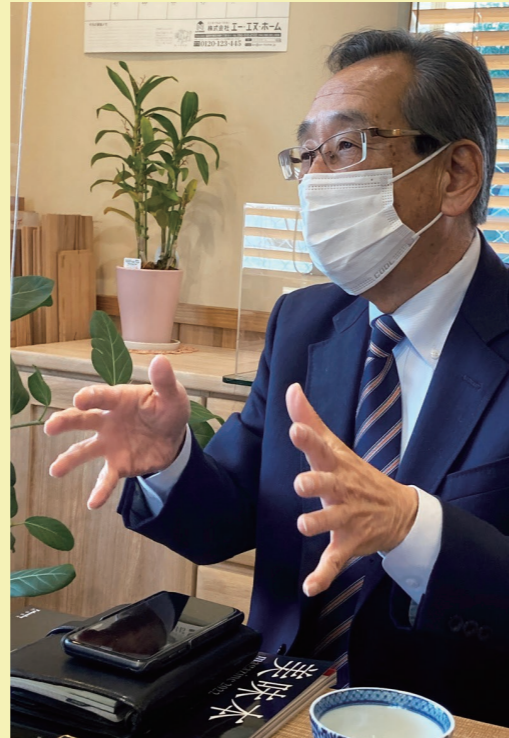
今日も元気に商談しています。 内容は・・・あれ？美味本？

電気自動車の普及には1.価格2.航続距離3.充電時間の3つの壁があると言われています。世界のメーカーが激しい覇権争いを繰り広げていますが、3つの壁をどうクリアするかが鍵だと思えます。近い将来、世界中の全ての車が化石燃料を使わない車になる事でしょう。一年の計は元旦にありと申します。私も何か新しいものに挑戦したものです。皆さんも何か新しい挑戦如何ですか？