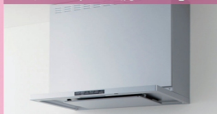
クリナップ「洗エール」